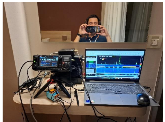
Slika 10 - Improvizovani PPS u hotelskoj sobi