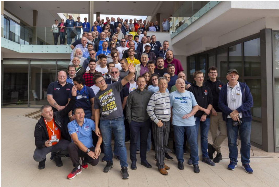
Slika 16 - Grupna slika

Polahko dolazi kraj programa trećeg Istra Contest Conference 2024, na kraju, kao šlag na tortu, tombola sa nagradama, objava rezultata 9A DX contesta koji je bio održan u decembru 2023. godine i objava i uručenje diploma i nagrada European HF Championship contesta.