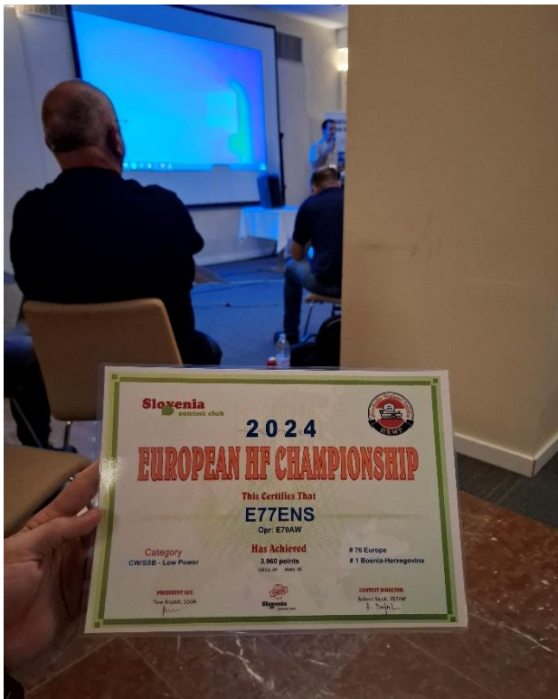
Slika 17 - EUHFC Diploma

Polahko dolazi kraj programa trećeg Istra Contest Conference 2024, na kraju, kao šlag na tortu, tombola sa nagradama, objava rezultata 9A DX contesta koji je bio održan u decembru 2023. godine i objava i uručenje diploma i nagrada European HF Championship contesta.