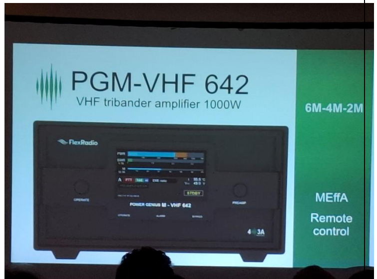
Slika 14 - Novi PGM - VHF 642 sa 1kW izlazne snage

Nakon malog predaha, Ranko je predstavio nove proizvode 403A, novopečeni lineari, filteri i tjuneri su svakako dobili cjelokupnu pažnju svih prisutnih.