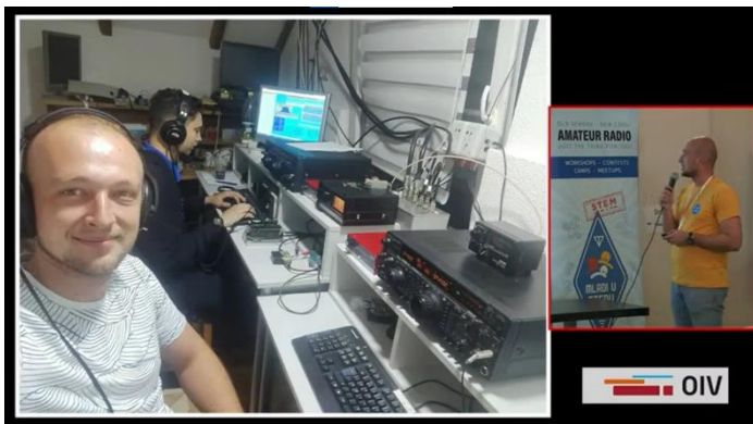
Slika 12 - E79AA; Prezentacija E7CW