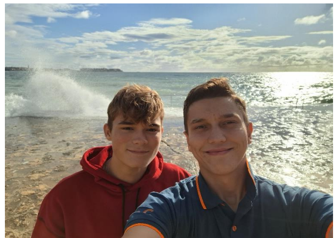
Slika 8 - Kiki E74CX i ja E70AW

važnost sna, pa smo tu dobili neke tips and tricks od aktivnih contestera.