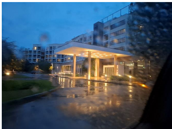
Slika 2 - Ulaz u hotel Materada

Vrijeme nije bilo na našoj strani, skoro tokom cijelog putovanja jaka kiša je padala. U Poreč smo stigli oko 19h, prvo smo smjestili Kristijana i Nebojšinu suprugu u apartman pa smo se nakon toga zaputili prema hotelu Materada gdje sam se ja smjestio.