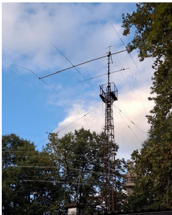
Slika 21- Antene radio kluba E74EBL u Banja Luci