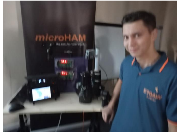
Slika 6 - Pokušaj slike mene sa MicroHam ARCO

Nakon prezentacije MicroHama, slijedi jedna od meni interesantnijih prezentacija, a to je fizički i mentalni aspekti u radio contestingu koju su pripremili dr.med YT3D & dr.med I2VXJ. Tu smo mogli vidjeti kako to neko sa