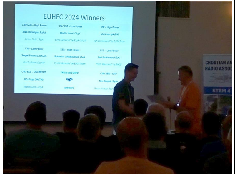
Slika 18 - Uručenje diplome za E77ENS

Nakon proglašenja pobjednika EUHFC, počinje proglašavanje pobjednika 9A DX 2023 contesta, pod euforijom koja je još trajala pažljivo sam pratio rezultate, ovog puta se ipak sjećaj da sam radio contest 😂.