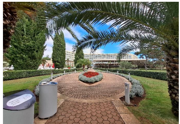
Slika 3 - Ulaz u hotel sa plaže

Naš turizam u Poreču nije trajao dugo, ubrzo nakon sto smo izašli opet je počela da pada kiša i samim time pokvarila nam atmosferu.