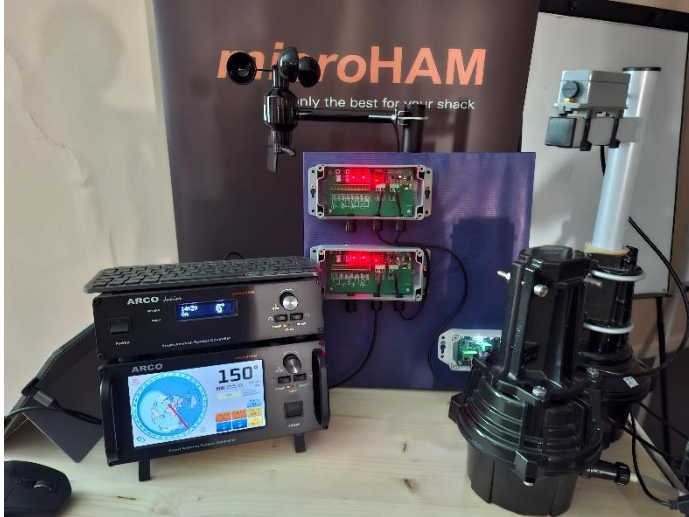
Slika 7 - MicroHam ARCO i ARCO Junior