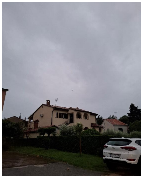
Slika 1 - Vrijeme u Poreču